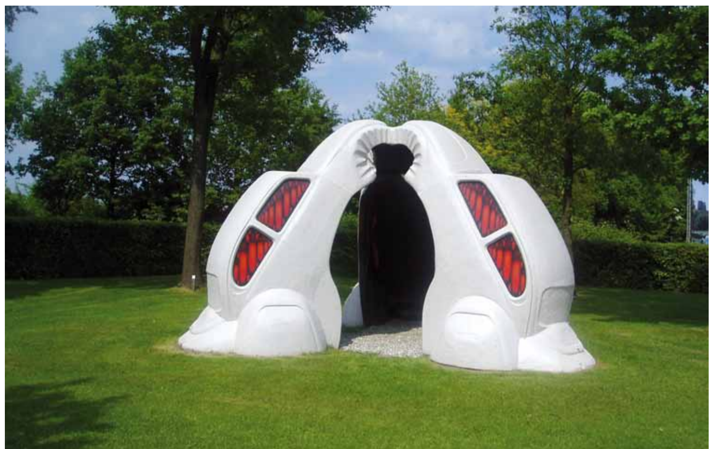
Temple of Doom (2011), Olaf Mooij.