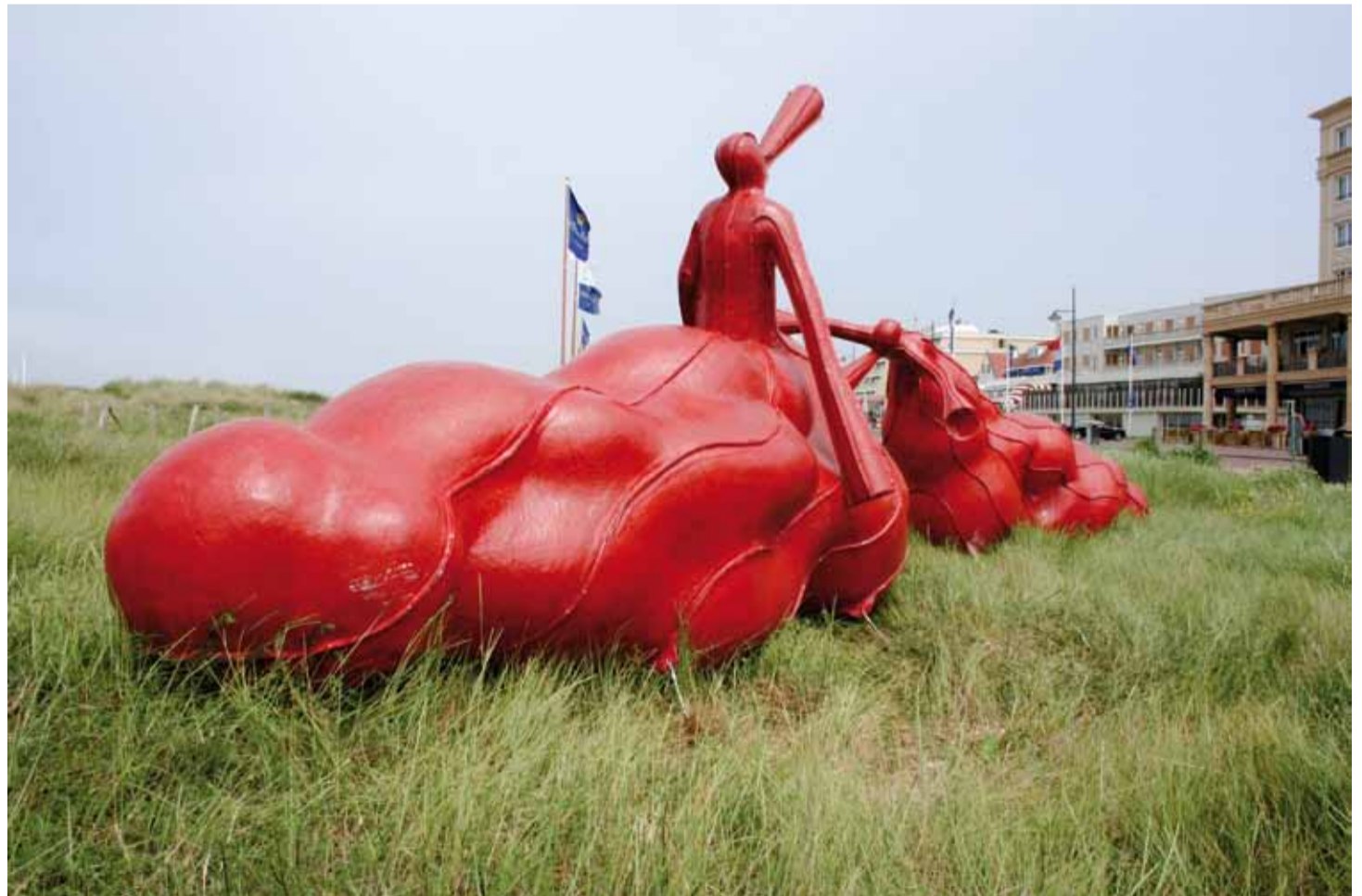
Your everyday paradise