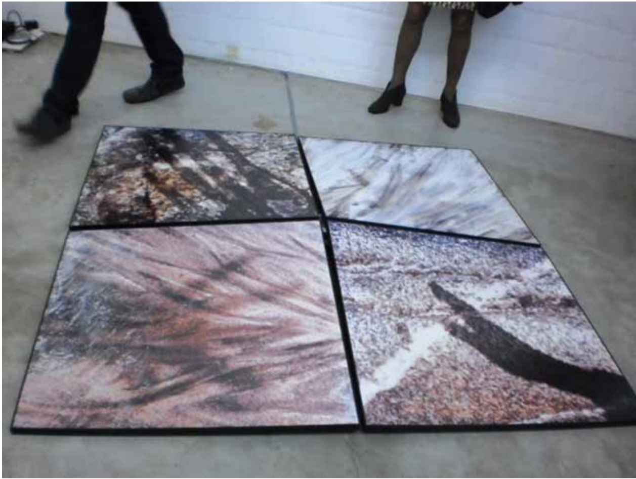
Four Directions (boven en onder)