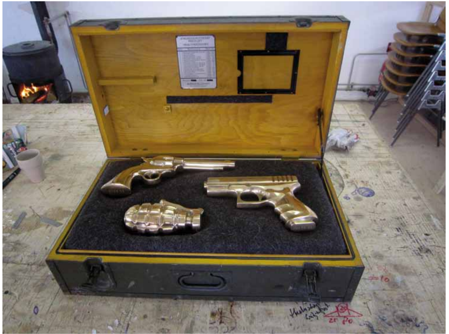
Toys to die for